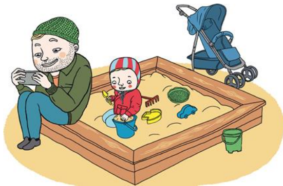
Illustration: Lotta Sjöberg, Statens medieråd, 2016